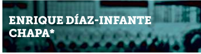
ENRIQUE DÍAZ-INFANTE CHAPA*