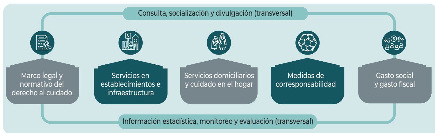
Figura 2. Ejes estratégicos para una política pública de cuidados

Fuente: CEEY (2023), Sistema Nacional de Cuidados: una vía para la igualdad de oportunidades y la movilidad social [Nota de Política Pública CEEY núm. 01/2022, versión actualizada 2023]. Centro de Estudios Espinosa Yglesias. https://ceey.org.mx/sistema-nacional-de-cuidados-una-via-para-la-igualdad-de-oportunidades-y-la-movilidad-social/